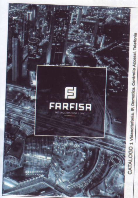
CATALOGO 1 Videocitofonia, IP, Domotica, Controllo Accessi, Telefonia

Il 2017 per Farfisa è stato un anno davvero ricco ed intenso: la celebrazione dei 50 anni di attività di citofonia ha coinvolto con passione tutto il team insieme ai collaboratori, ma il redesign del logo, una rivisitazione importante dell'immagine aziendale e il nuovo sito web continuano a stu-