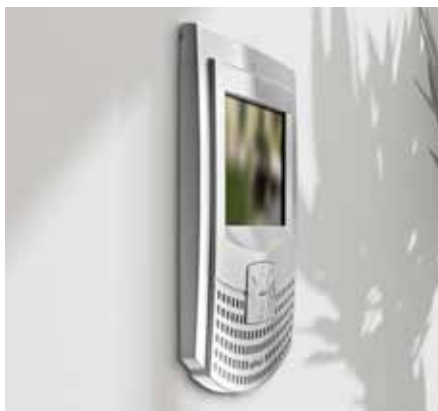
myLogic avec boîtier d'encastrement ML2083

Adaptateur pour tous les moniteurs MyLogic qui permet l'utilisation sur table, à monter avec les adaptateurs WA2160W ou WA2160T, fourni avec le câble de raccordement.