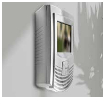
myLogic avec adaptateur montage en saillie WA2160W