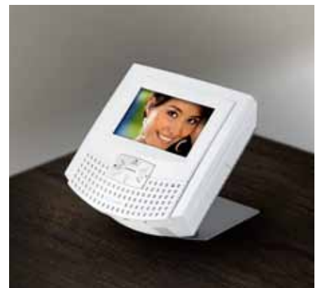
myLogic avec adaptateur pour table TA2160