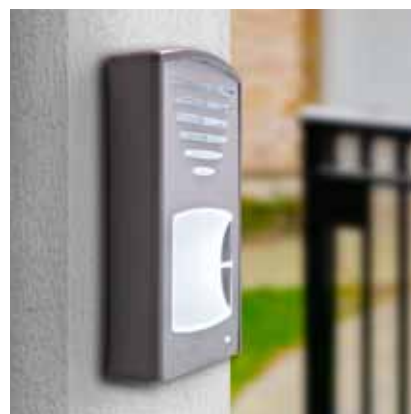
Click filo muro con 2 pulsanti di chiamata (94 x 150 x 28 mm)