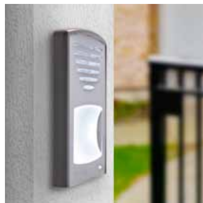
Click da incasso con 1 pulsante di chiamata (94 x 150 x 17 mm)